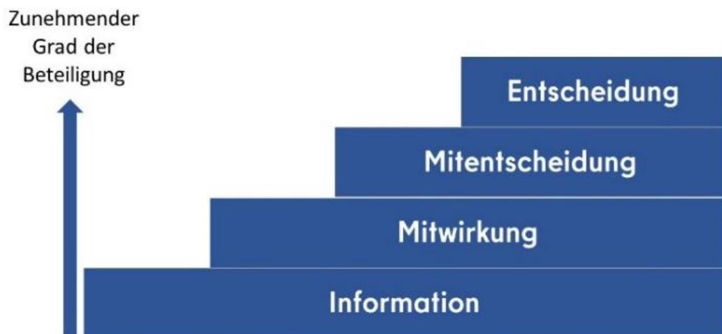
Abb. 1: Stufen der Partizipation